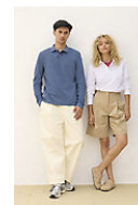
SOL'S PACIFIC LSL 04441